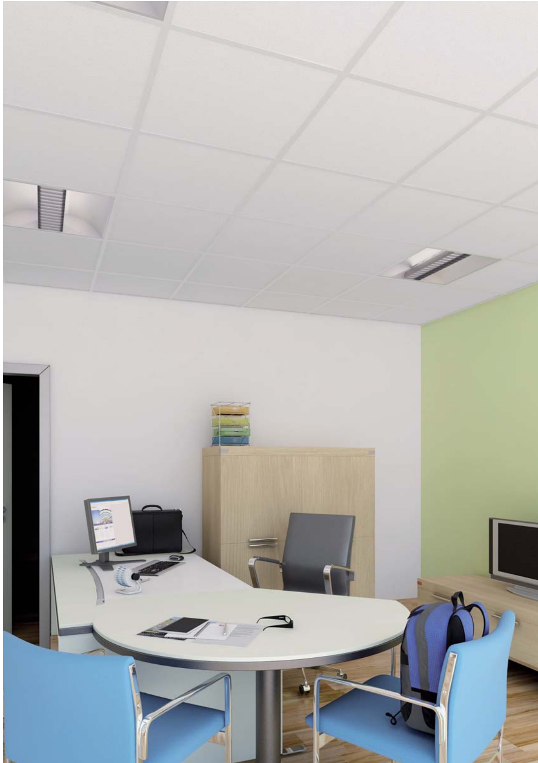
RETAIL 90RH Board